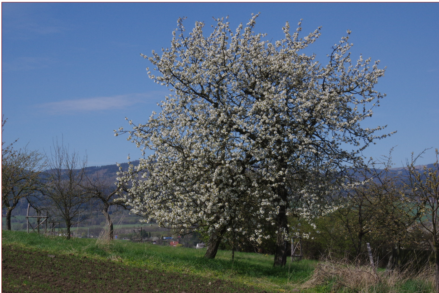
Doupovské hory nedaleko Ostrova