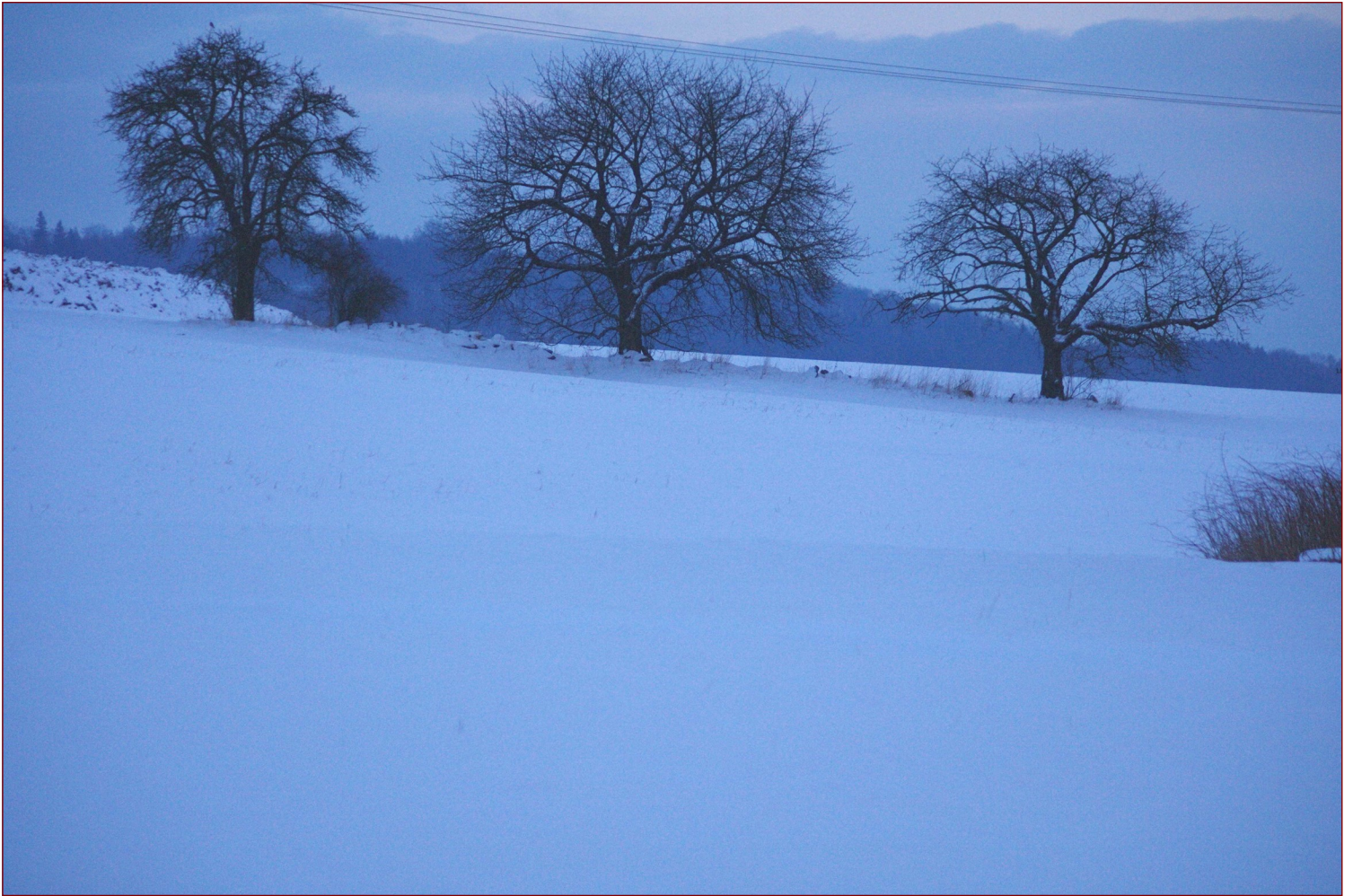
Dvě Napoleonky ve společnosti s neznámou hrušní v Merbolticích