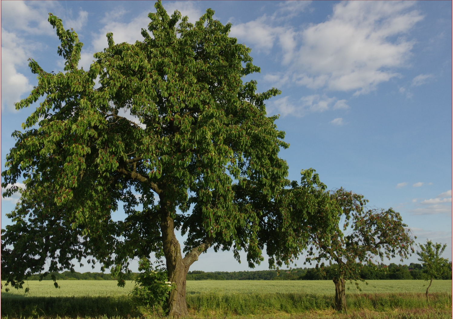
Dnes již mrtvý strom nedaleko Mšena