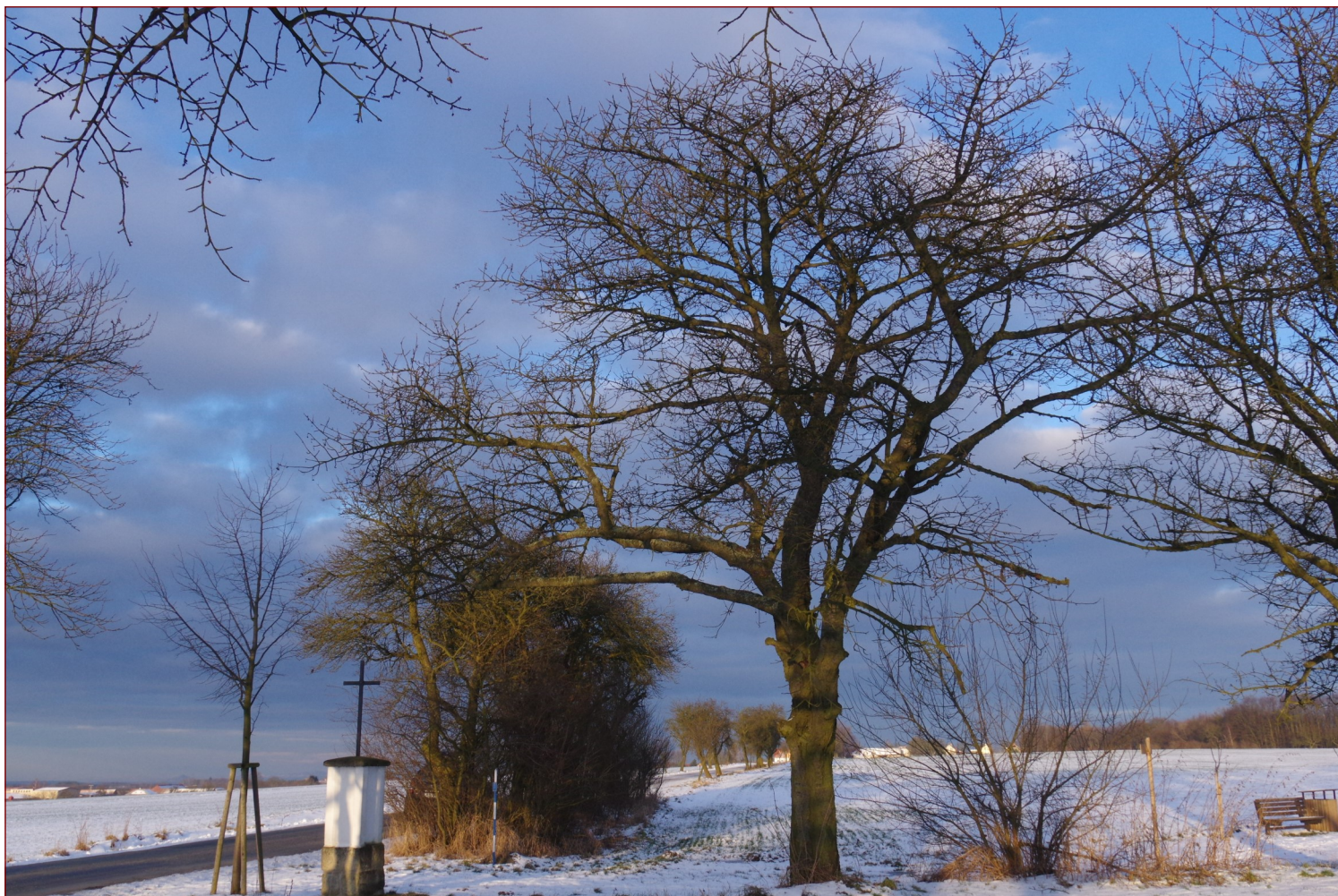
U aleje Františka Smýkala ve Mšeně