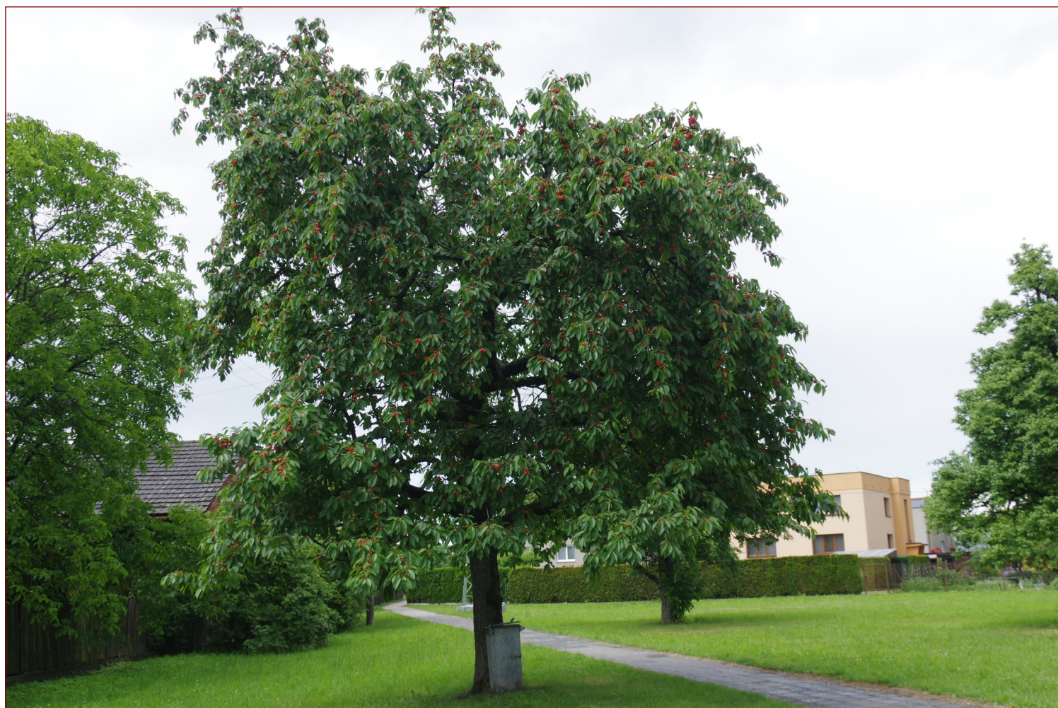
Dolní Benešov u Opavy