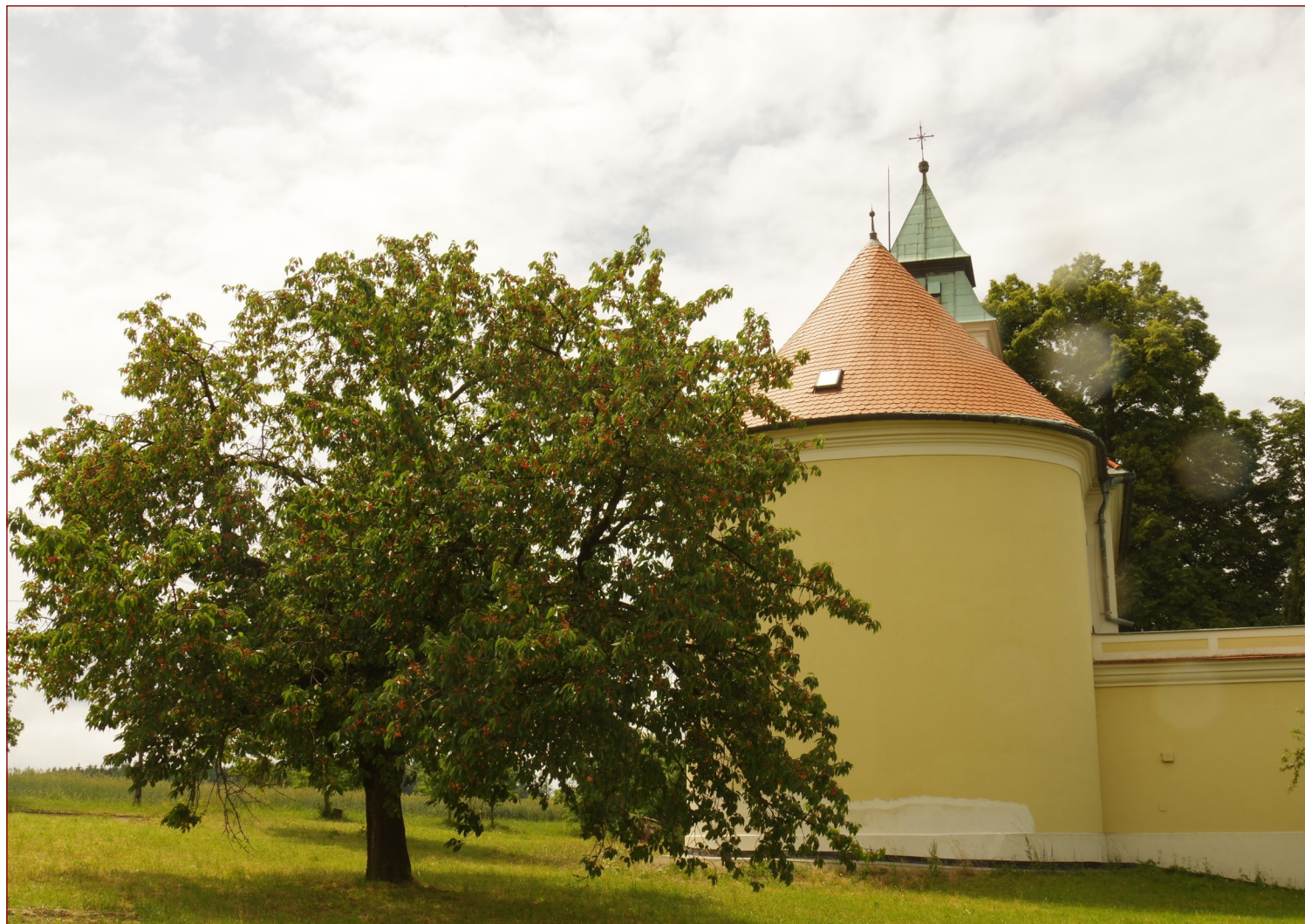
Bukovinka - Moravský kras