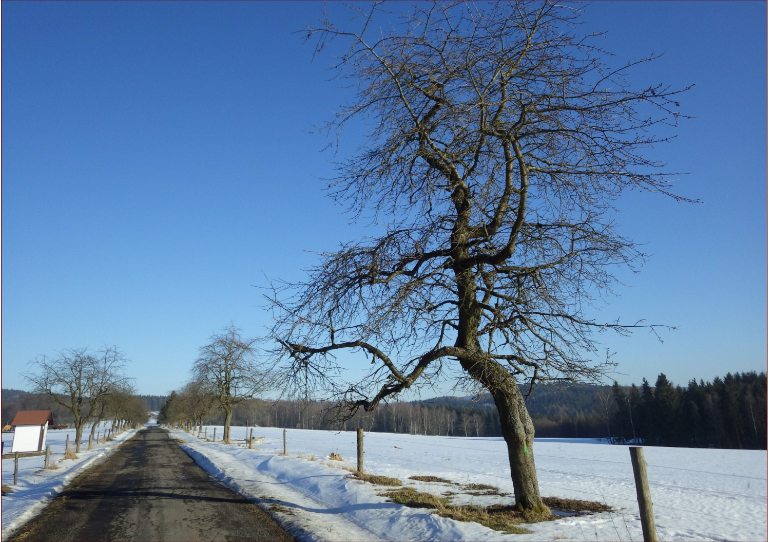
Slavkovský les nedaleko Arnoltova u Sokolova