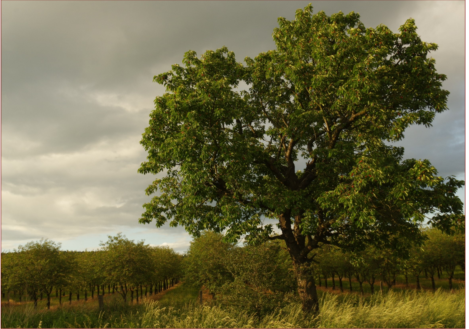
Vanovice nedaleko Boskovic