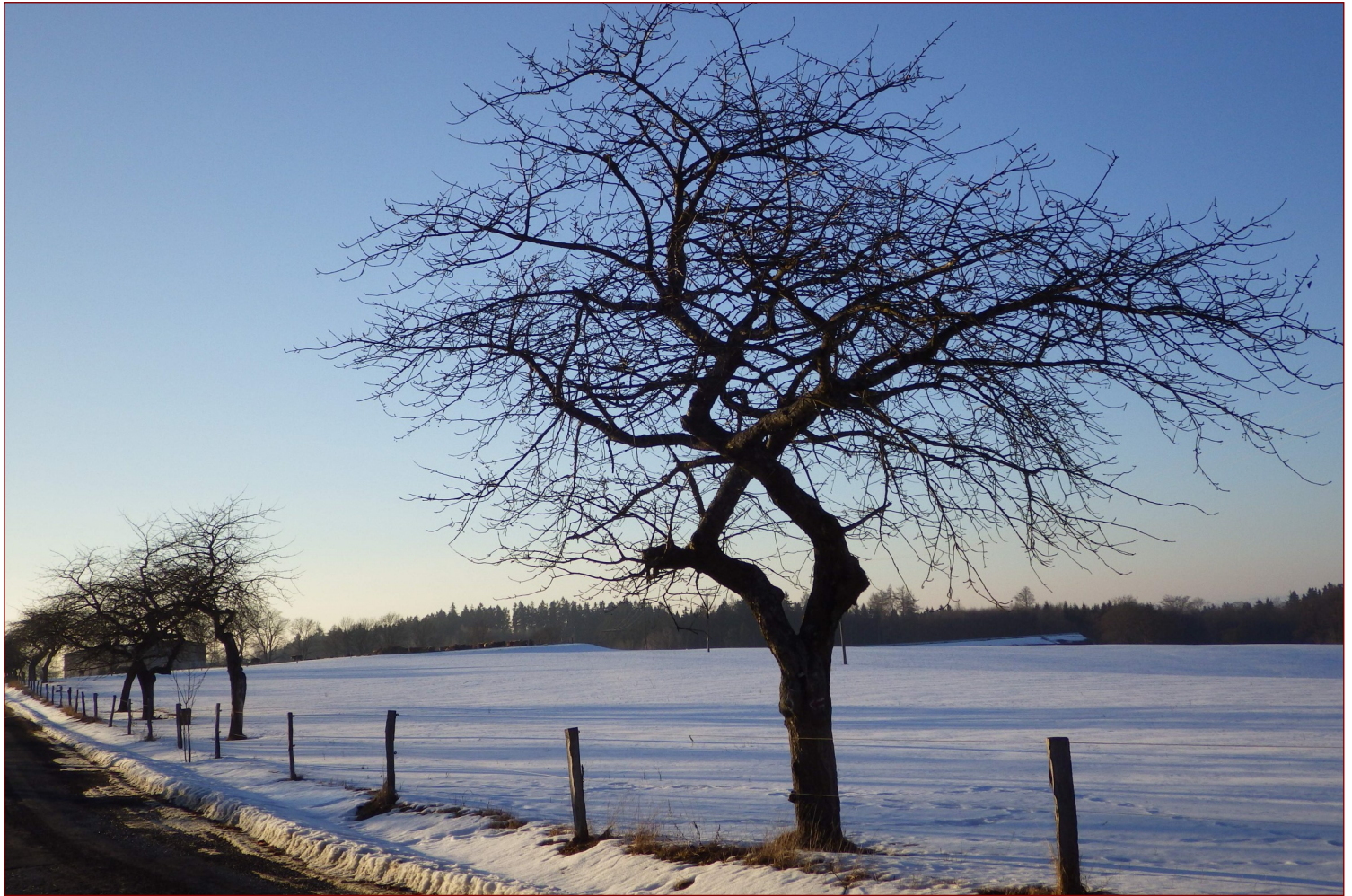
Kostelní Bříza ve Slavkovském lese