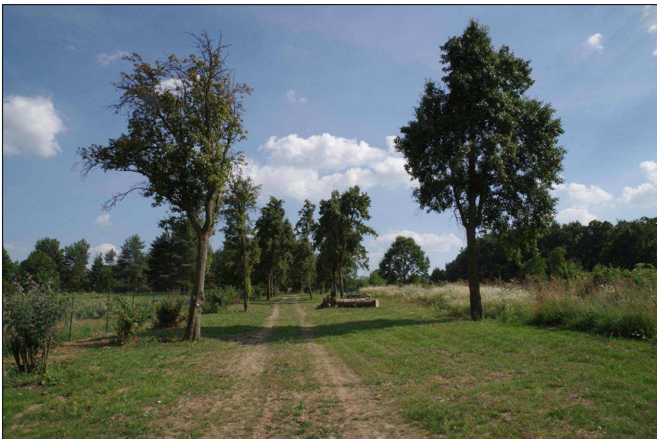
Zbytky výsadeb fruticeta jsou místy již hodně řídké. Hrušně zde také silně trpí rží hrušňovou.