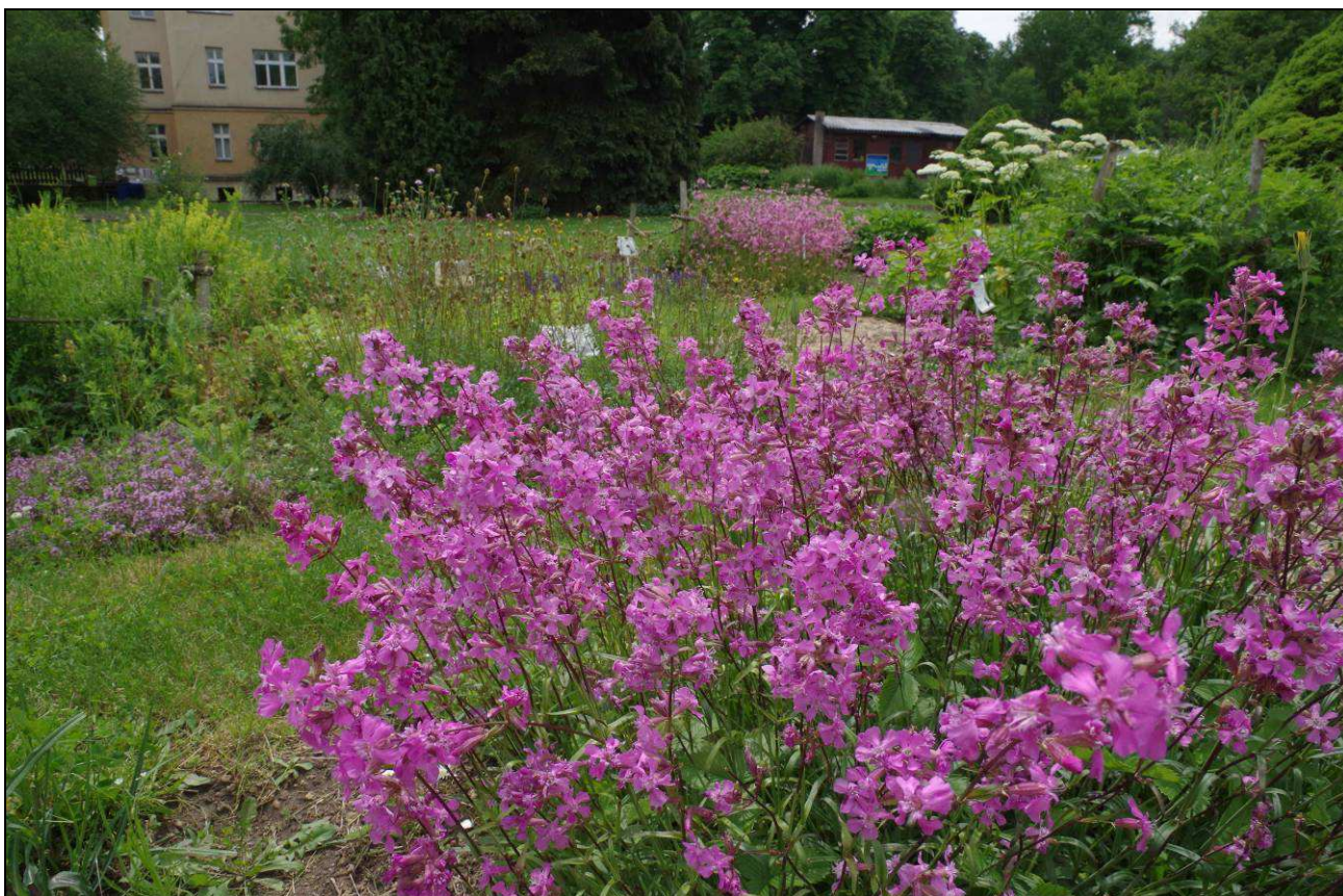
Školní botanická zahrada v Dalovicích hostí celou řadu lučních druhů rostlin. Konec května a počátek června je ve znamení pestré přehlídky květů.