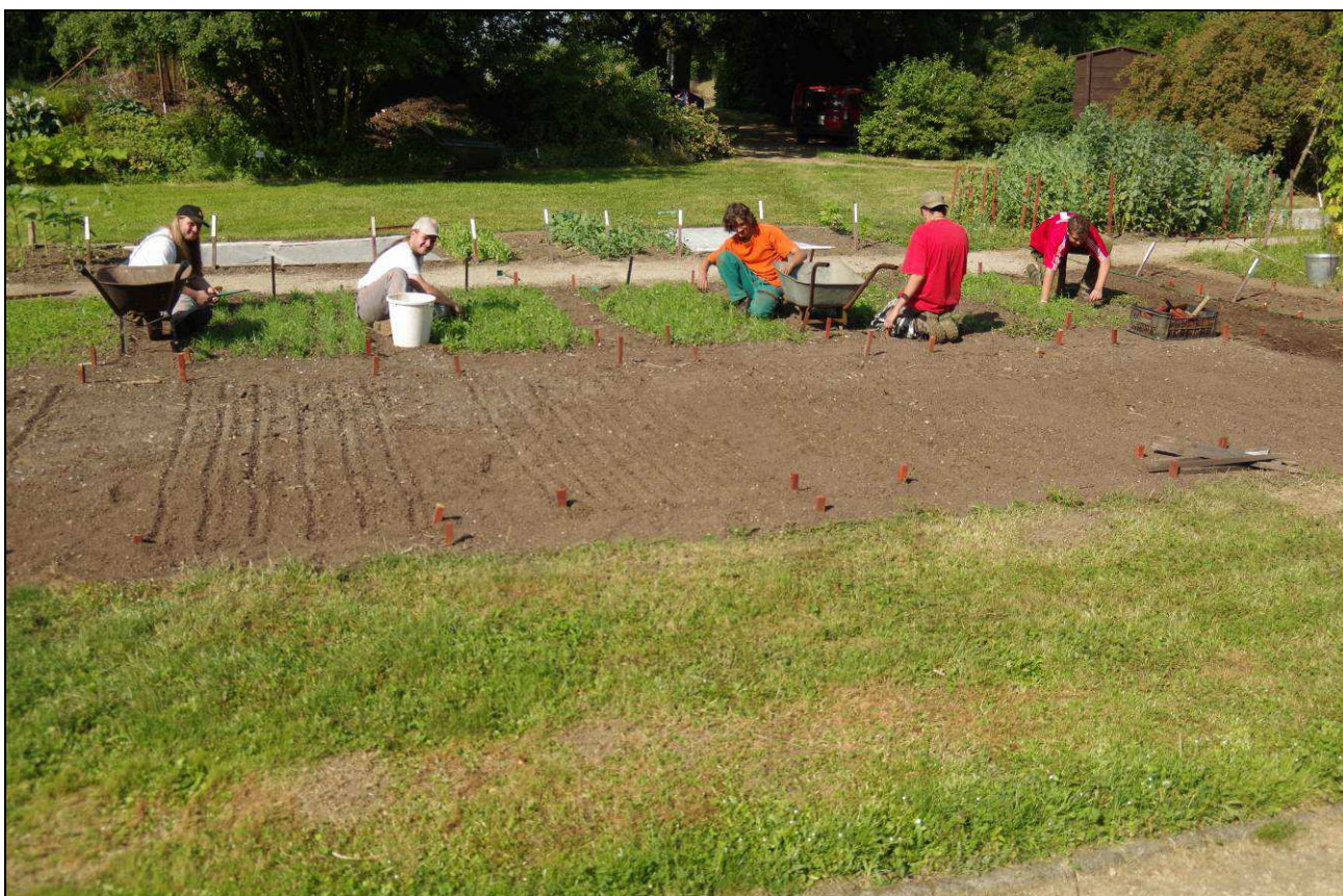
Péče o záhony je nikdy nekončící prací pro trpělivé prsty i oči.