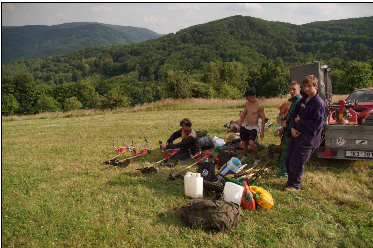
Každoroční péče o tuto pestrost je jednou z hlavních náplní činnosti ekologického centra Meluzína.