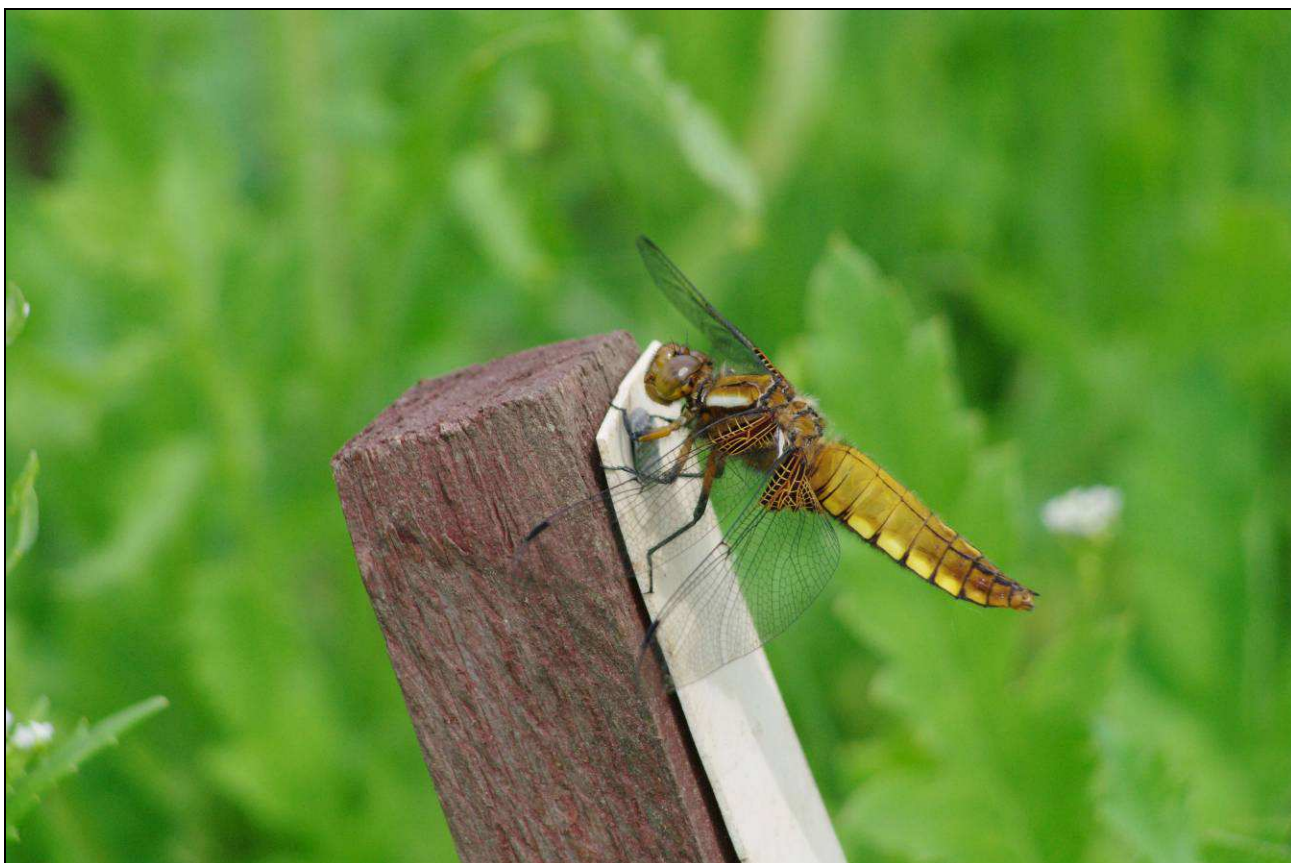
V zahradě žije i celá řada živočišných druhů (vážka ploská).