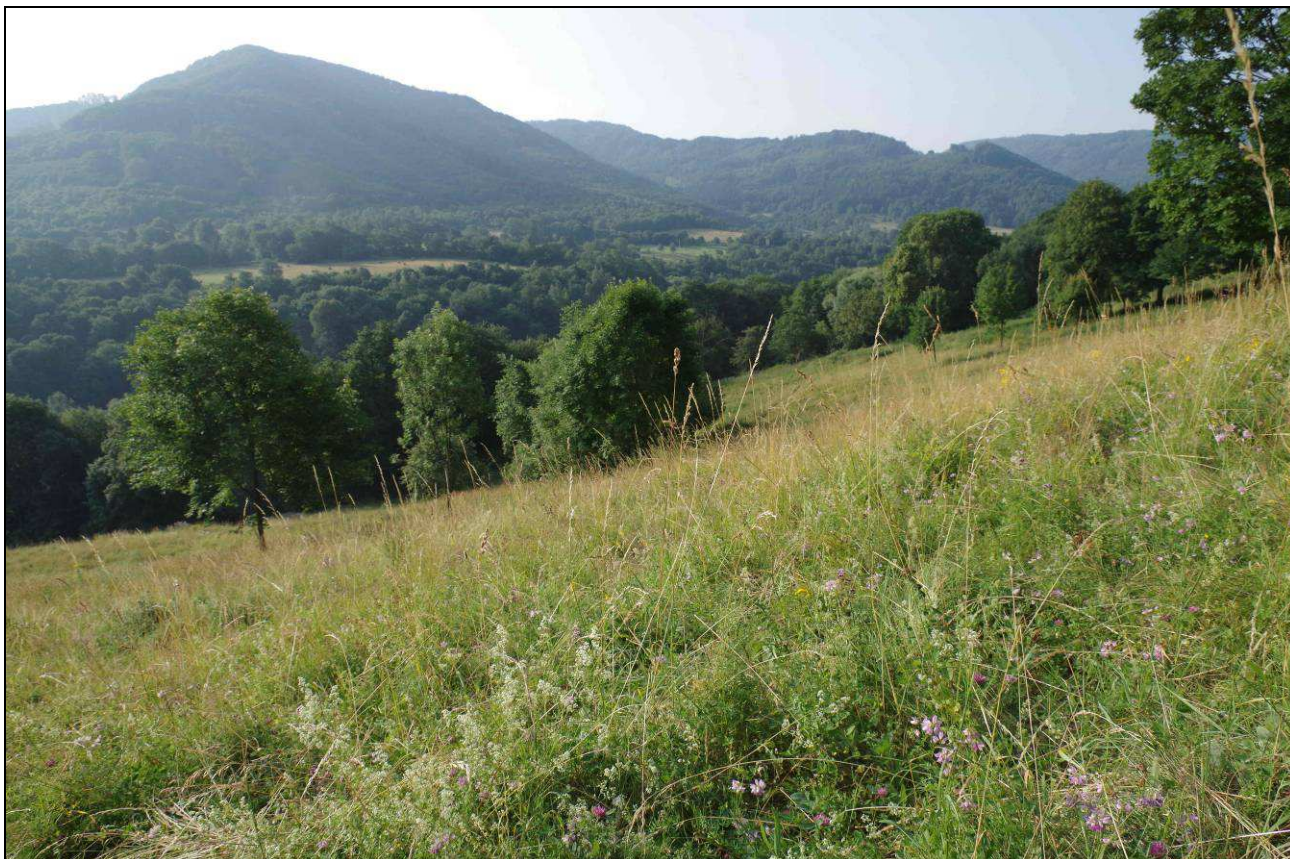
Díky sopečným horninám Doupovských hor je Karlovarský kraj botanicky velmi pestrá oblastí..