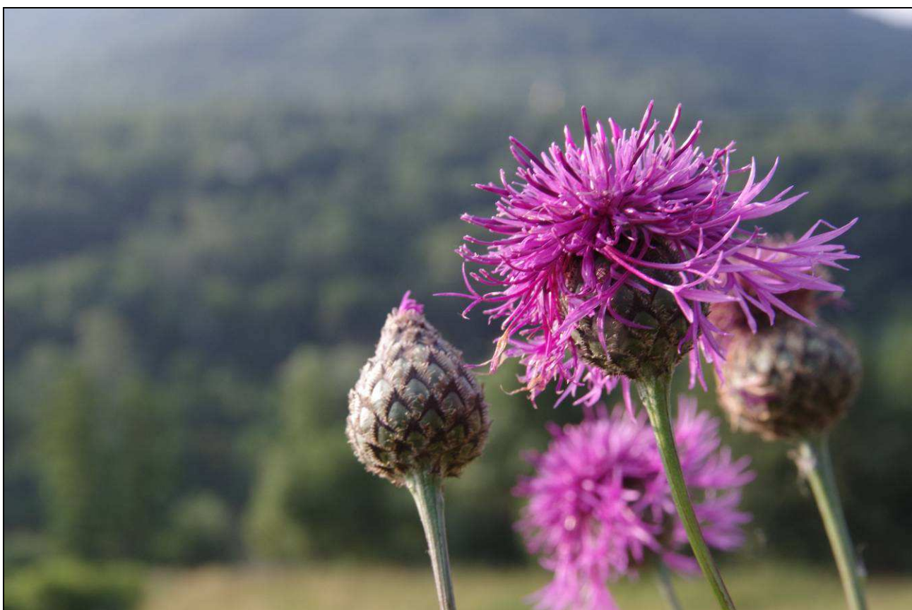
Základem druhové ochrany rostlin je ovšem jejich zachování v přírodě na původních stanovištích – v našem případě na loukách a pastvinách (běžně rostoucí chrpa čekánek Centaurea scabiosa )