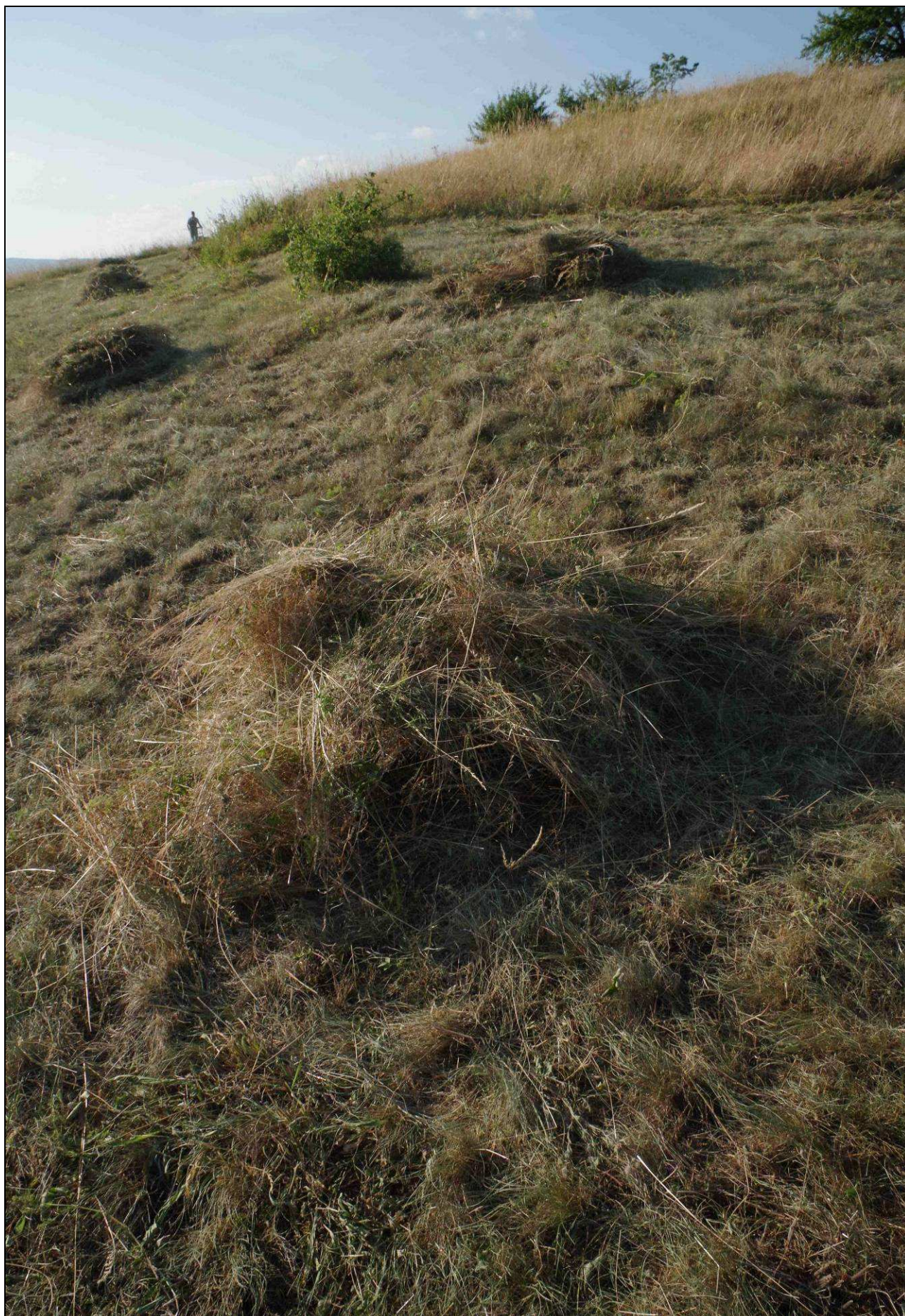
Druhové pestrosti luk nejvíce prospívá tradiční technologie sečení s následným sušením hmoty přímo na pokose. Semena rostlin mohou dozrát a doplnit půdní zásobu.