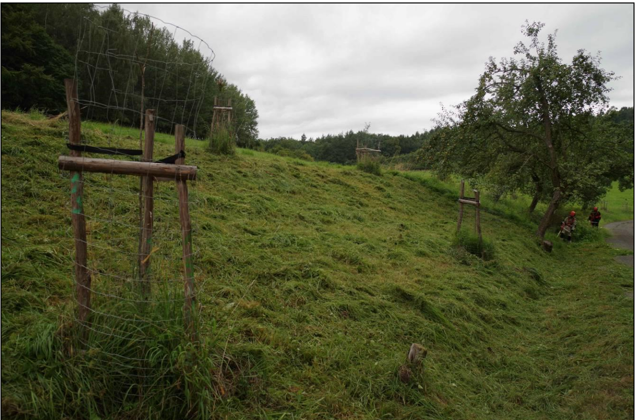
IMGP3307_321408.jpg Pro regulaci výmladků a obnovu květnatého charakteru lučních společenstev je nezbytná dvojitá seč v průběhu vegetace