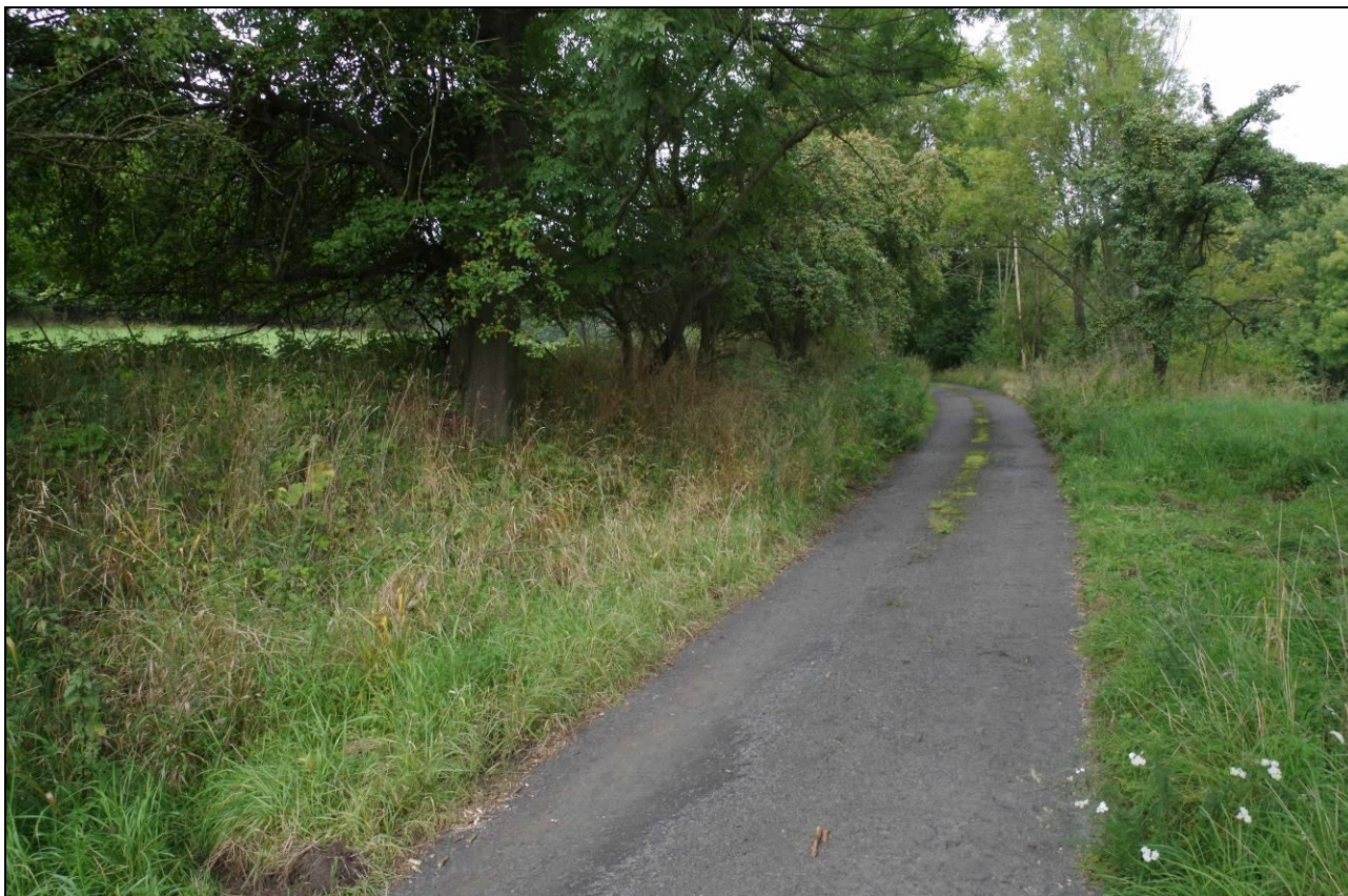
IMGP3277_321408.jpg Stav jižní části lokality byl typický masívním přerůstáním ovocných dřevin dřevinami náletovými