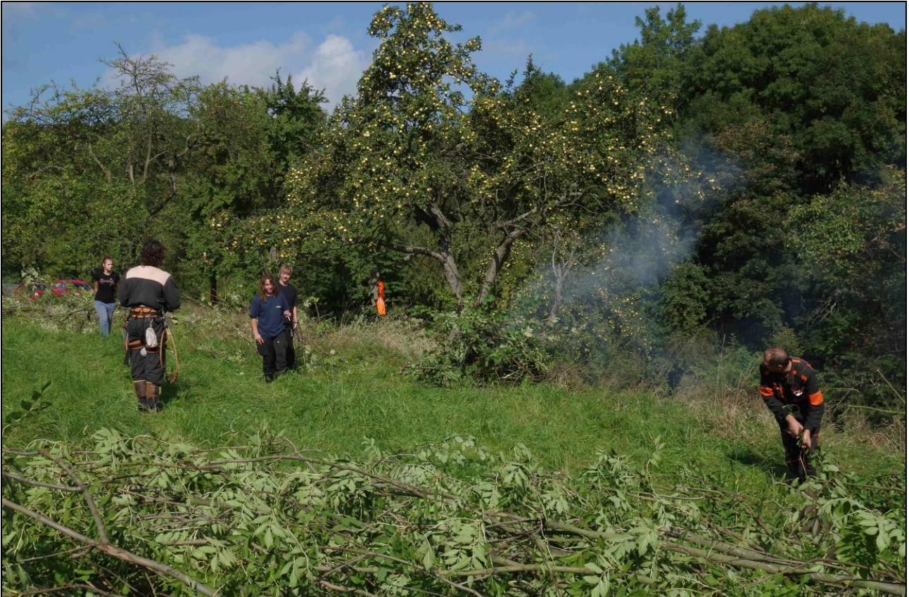
IMGP4103_321408.jpg Práce na lokalitě Hlupice vyžadovala velký objem fyzické práce při regulaci náletových dřevin včetně odborné práce stromolezce při rizikovém kácení a ošetření ovocných stromů