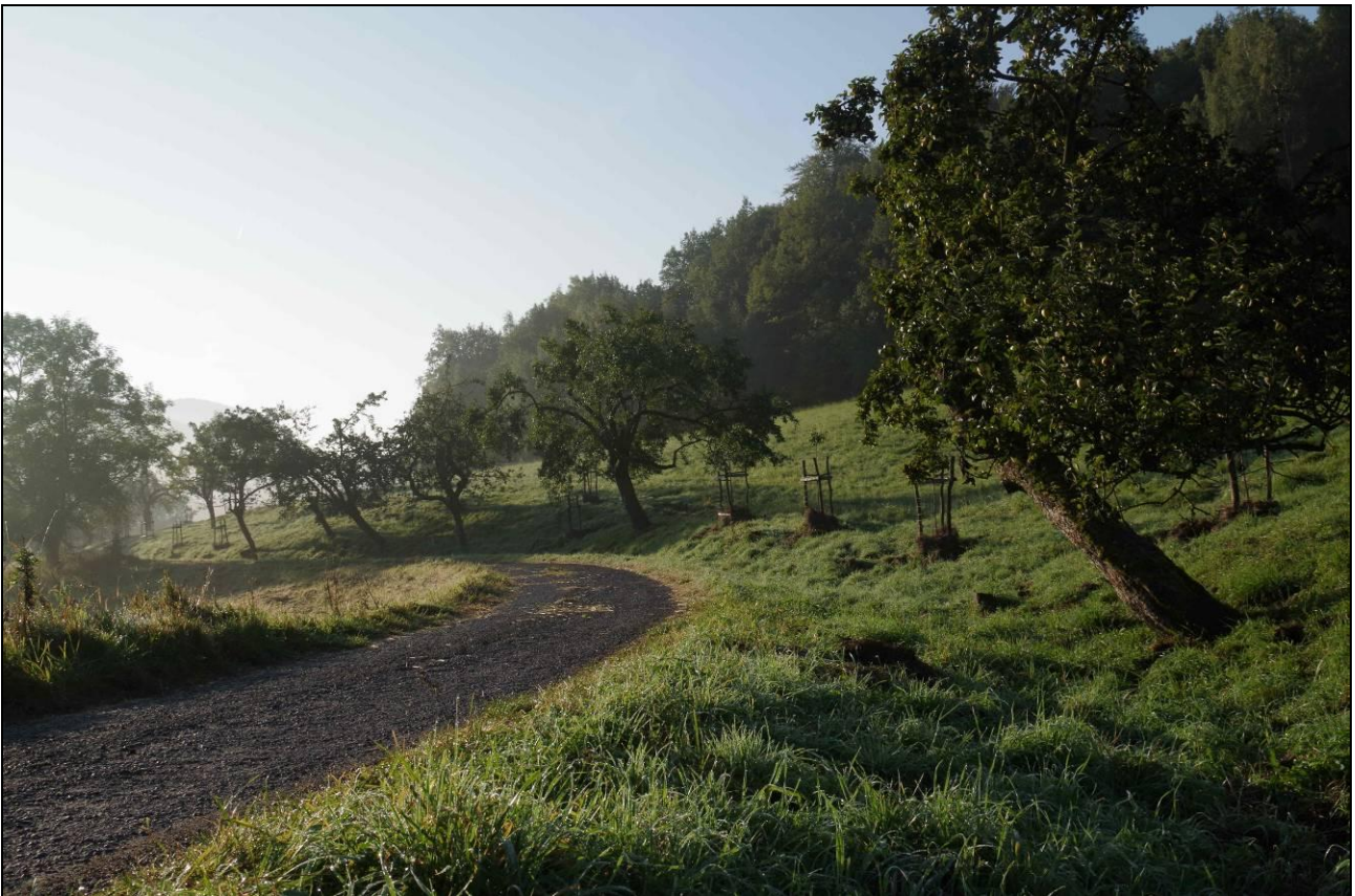
IMGP4148_321408.jpg Stav na konci září 2014 po likvidaci křovin, dvojitě seči, ošetření původních stromů a dosadbě starých odrůd hrušní