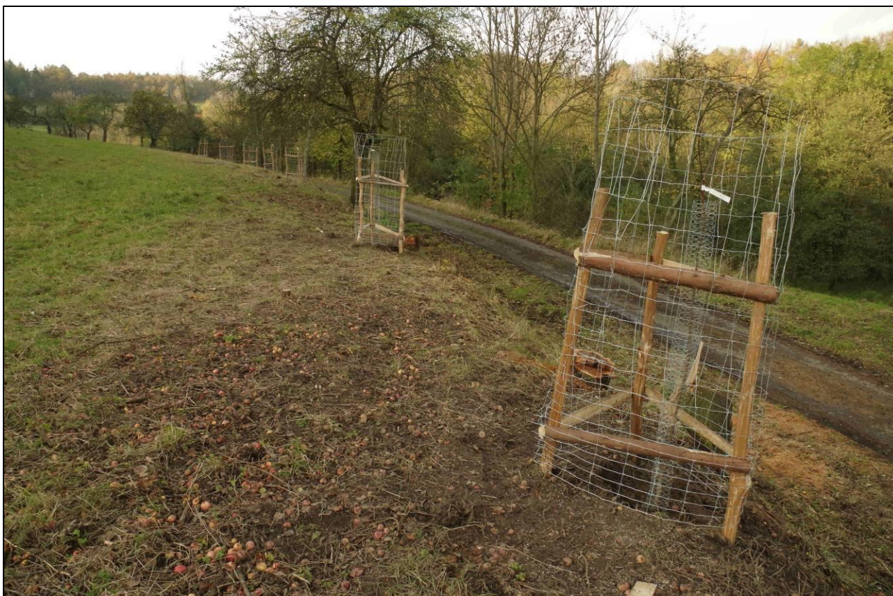
IMGP4605_321408.jpg V říjnu 2014 byla lokalita již zpětně převedena na ovocnou výsadbu typickou pro České středohoří.