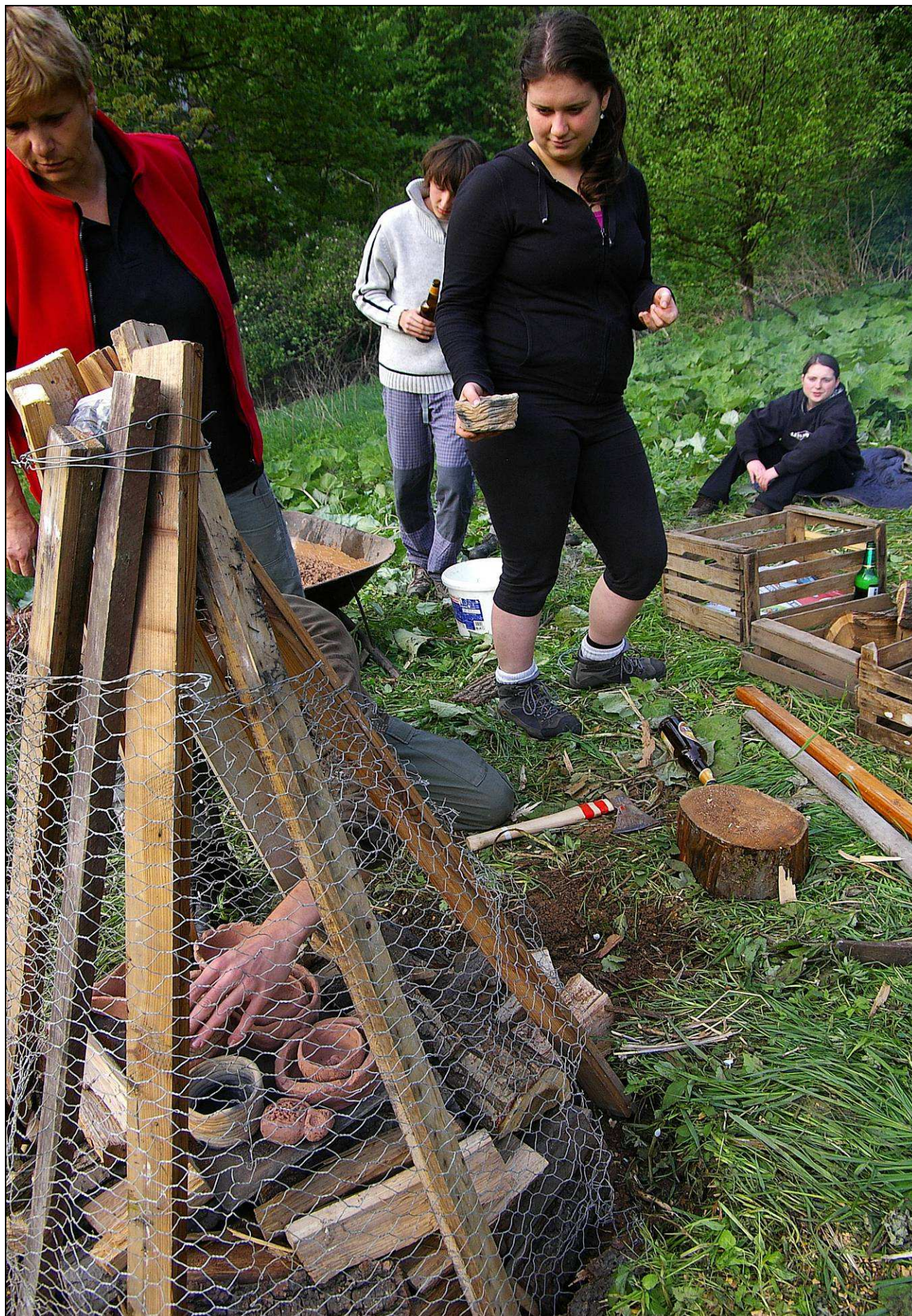
Foto: IMG8048 Keltska pec 090501.jpg objekt: vikendovka v EVL Doupovské hory s výrobou keramiky