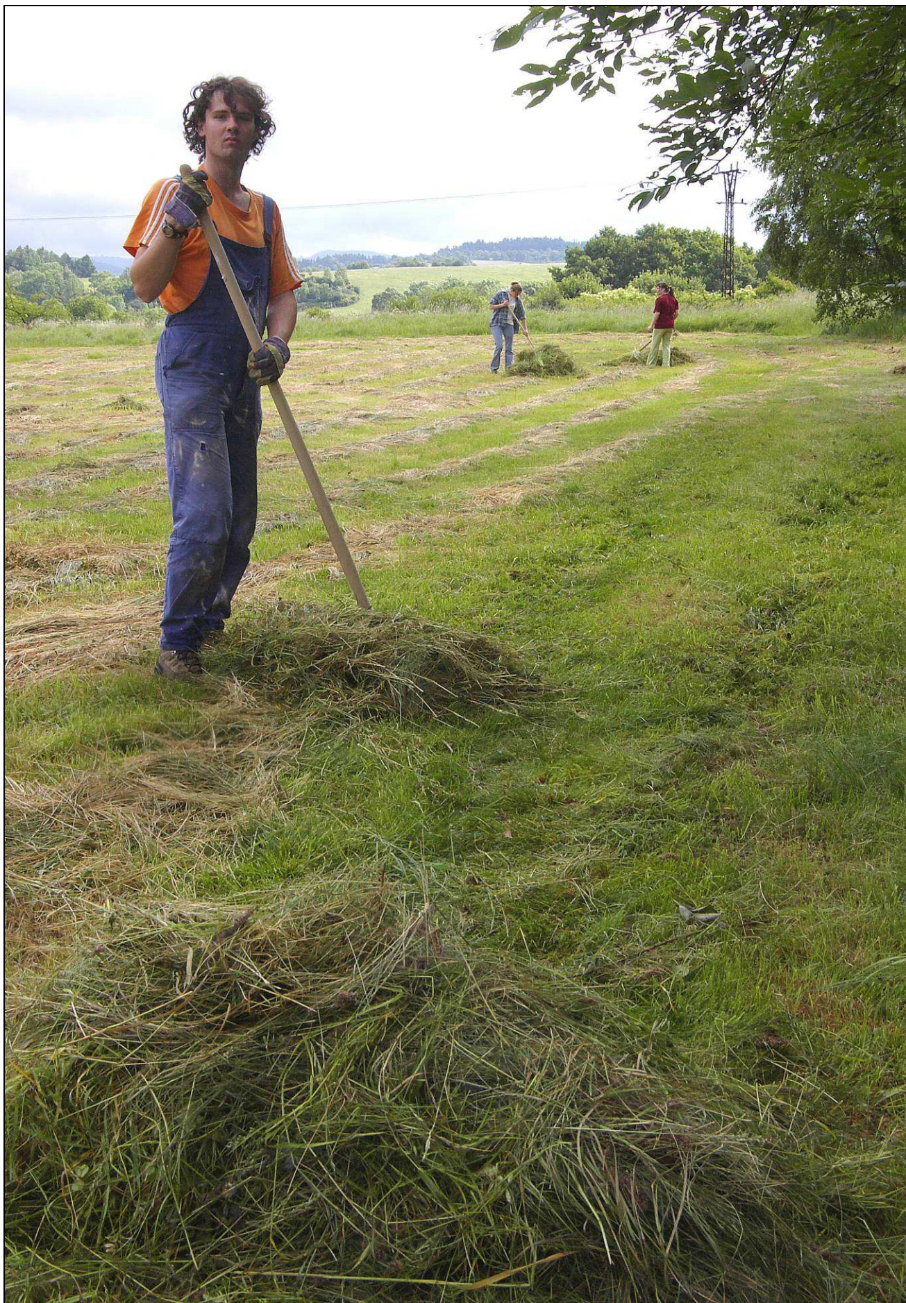
Foto IMG9386 Posp_i_090610.jpg objekt: při údržbě chráněných ploch jsme nejčastěji ošetřovali louky