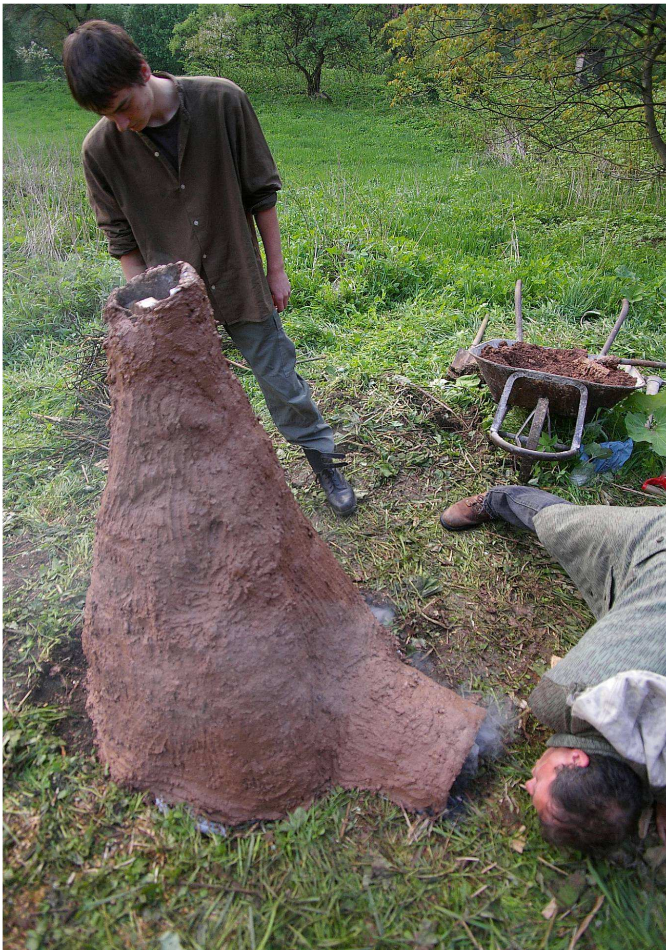
Foto: IMG8106 Keltska pec 090501.jpg objekt: víkendovka v EVL Doupovské hory s výrobou keramiky - zapalování pece

Projekt D 764/2009-Pozemkový spolek Meluzína autor: Martin Lípa, květen 2009