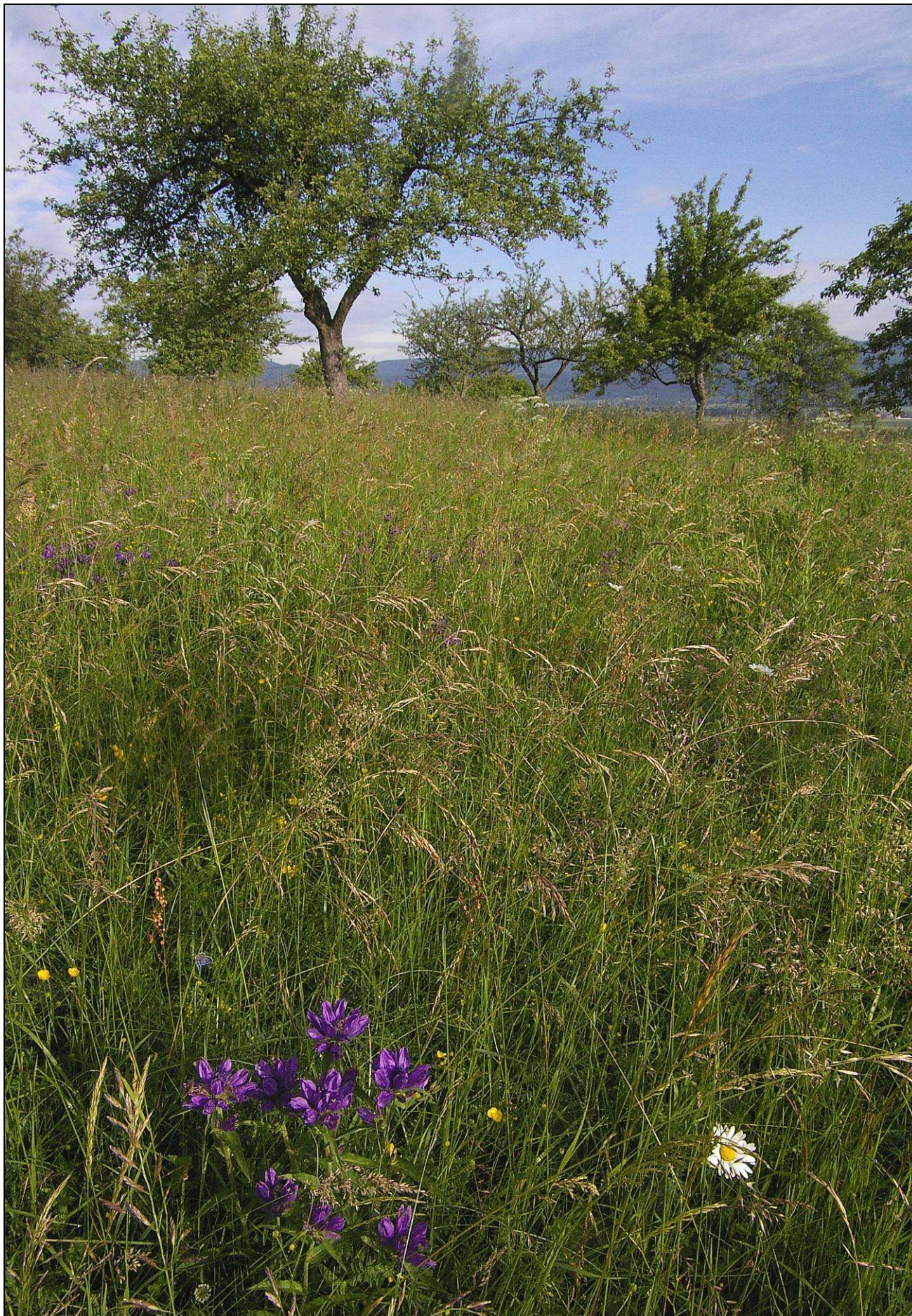
Foto: IMG9341 VV_090609.jpg objekt: lokalita Větrný vrch kde byl proveden botanický průzkum

Projekt D 764/2009-Pozemkový spolek Meluzína autor: Martin Lípa, červen 2009