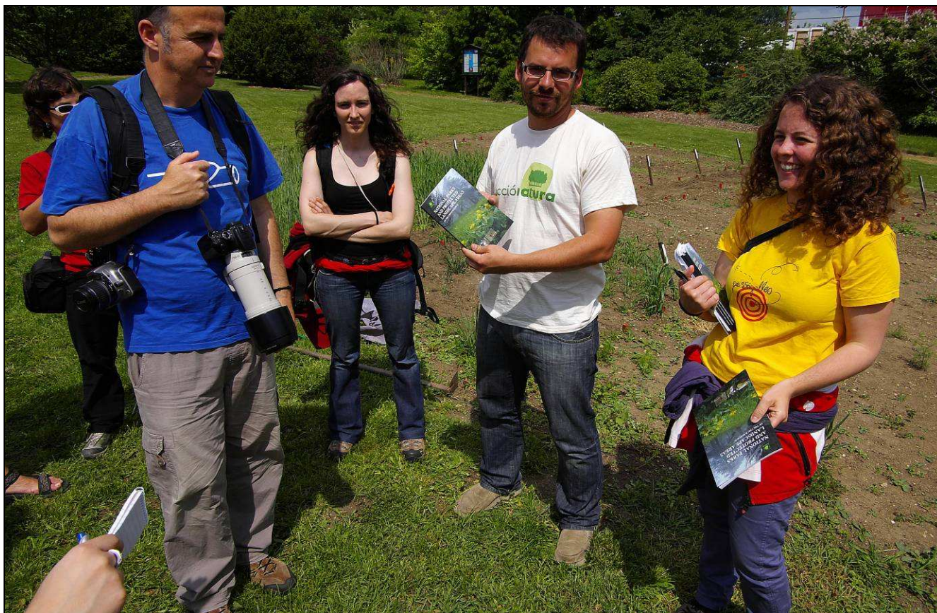
Foto: IMG8740 Katalanci 090520.jpg. objekt: Návštěva pozemkových spolků z Katalánska

Projekt D 764/2009-Pozemkový spolek Meluzína autor: Martin Lípa, květen 2009