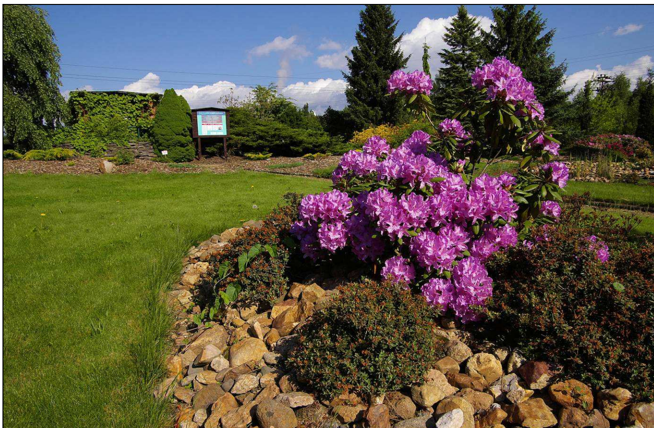
Foto: IMG8690_09_05_19.jpg. objekt: Botanická zahrada v Dalovicích je připravena na provádění environmentální výchovy a vzdělávání autor: Martin Lípa, květen 2009

Projekt D 764/2009-Pozemkový spolek Meluzína autor: Martin Lípa, květen 2009