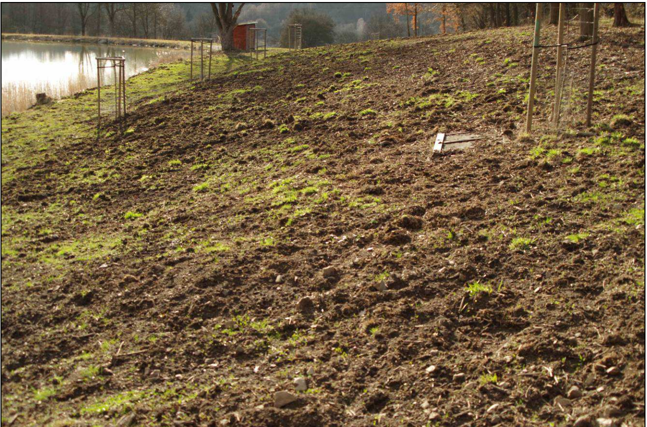
Činnost černé zvěře začíná být limitující pro drobné obratlovce. Snižování jejich stavů je v nedohlednu a proto je nezbytné vybavit stanoviště dostatečnou nabídkou bezpečných úkrytů.