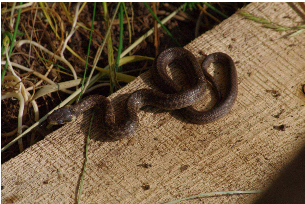
Jeden ze tří juvenilních jedinců užovky stromové nalezených ve VKP Jakubovské sady v roce 2013.