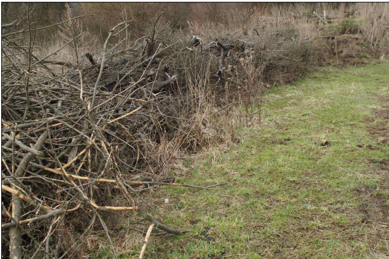
Tento typ úkrytu poskytuje užovkám poměrně vysoký stupeň bezpečí.