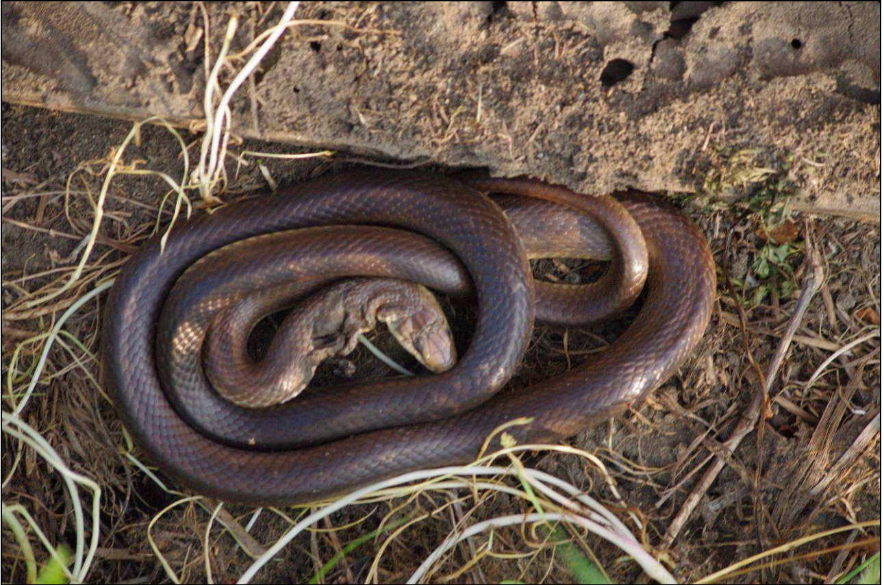
Tento dospělý exemplář užovky stromové s výrazným zraněním od neznámého predátora používal umělý úkryt minimálně po dobu 2 měsíců.