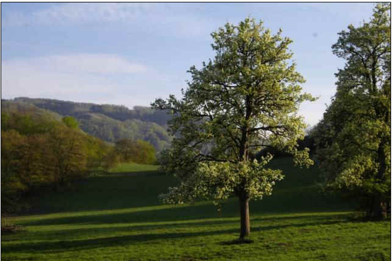
Doupovské hory - Salisburyova - květen 2007

Strom roste bujně a tvoří nádherné koruny. Dokonce jsme při mapování potkali hrušně přes 10m vysoké.