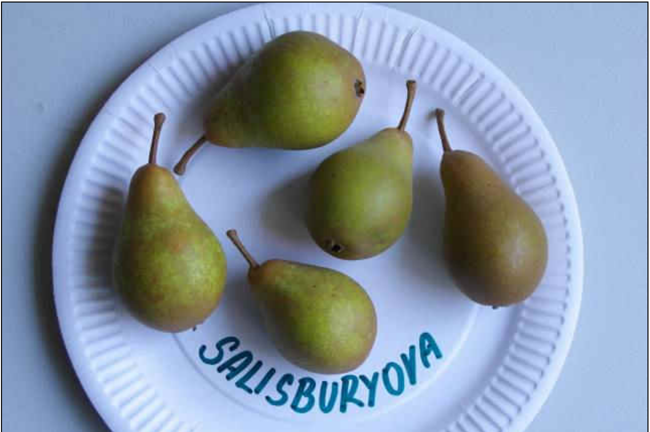
Září 2007 - plody ve sklizňové zralosti dobře snáší přepravu a na skládce dozrají během tří týdnů nebo měsíce.

Pouze na chudých půdách prý bývá natrpklá ale zatím jsem takovou nejedl.