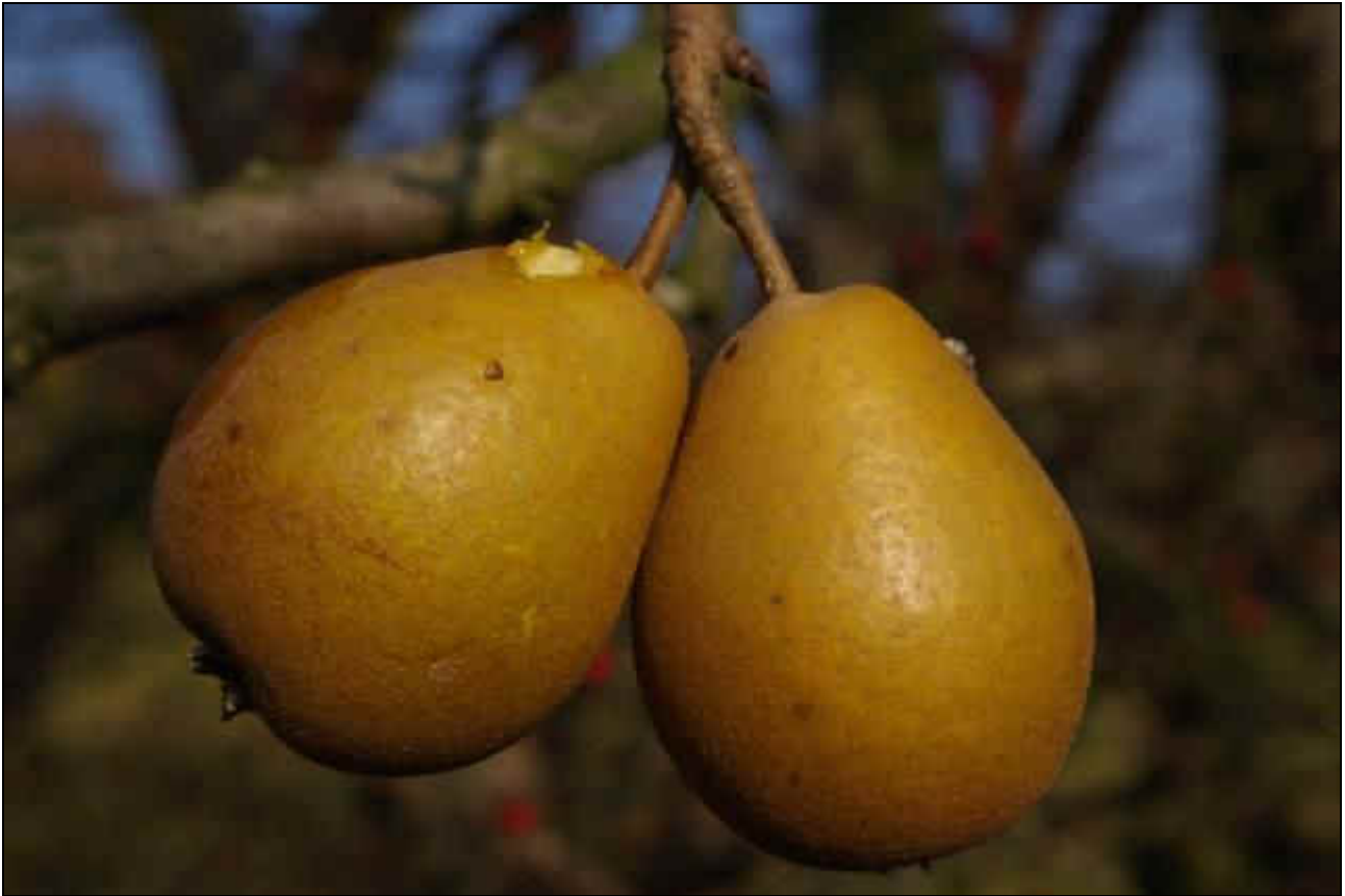
Říjen 2008 plně vyztřálé plody - odrůda Salisburyova