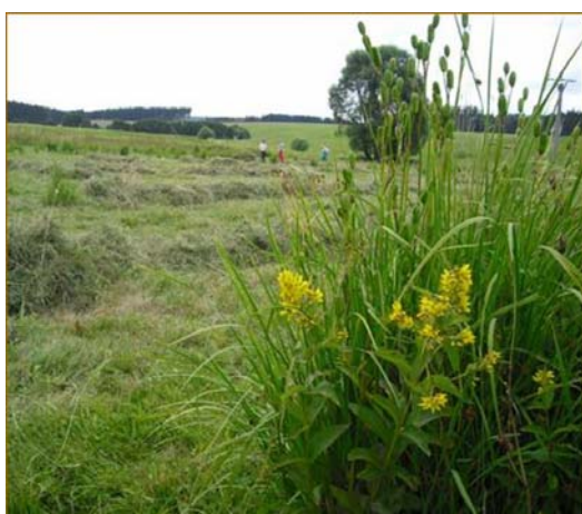
Přírodní památka Pracomety— kosatec sibiřský

Projektová činnost centra zahrnuje také dlouhodobější aktivity. V jejich rámci vyvozujeme aktivity na ochranu jednotlivých druhů živočichů nebo například na zdokonalení podmínek pro ekologickou výchovu.